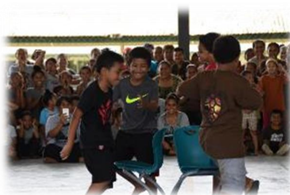
6年生の椅子取りゲーム