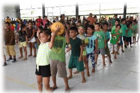
2年生のボール送り

ポンペイの小学校では日本のような運動会は行われていません。と思っていたら、つい先日1学期が終わったことをお祝いするイベントが開かれました。1年生から8年生までの子どもたちが8つのカラーに分かれて競技を行い、順位を競います。「これは運動会じゃないか！」と驚きました。綱引きやいす取りゲーム、ボール送りなど私たちのよく知っている競技も行われていました。